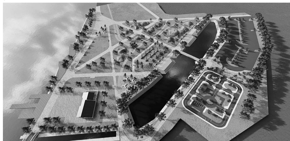
ул. В.Павленко 63 «парк 3 этап»